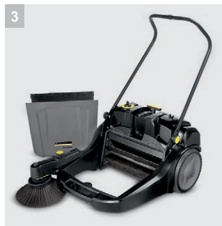
3 Большой контейнер для мусора