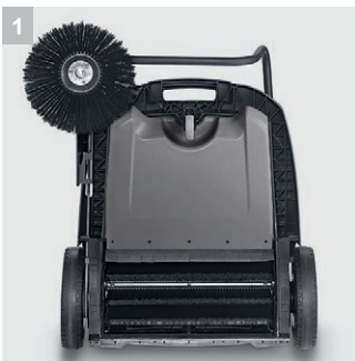
1 Привод цилиндрической щетки

Машина KM 70/20 C 2SB – идеальное решение для уборки малых площадей в помещениях и на открытом воздухе. Ускоряет уборку в сравнении с обычной метлой, но и практически исключает пылеобразование благодаря встроенному фильтру. Версия 2SB оснащается двумя боковыми щетками.