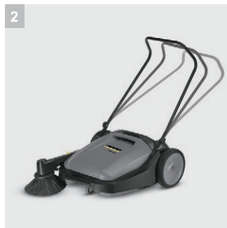
2 Регулируемая рукоятка