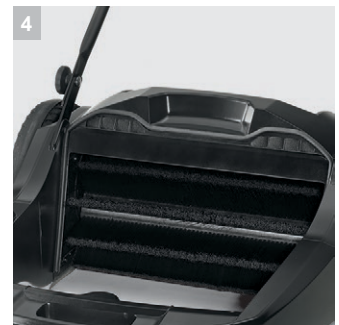
4 Фильтр для пыли