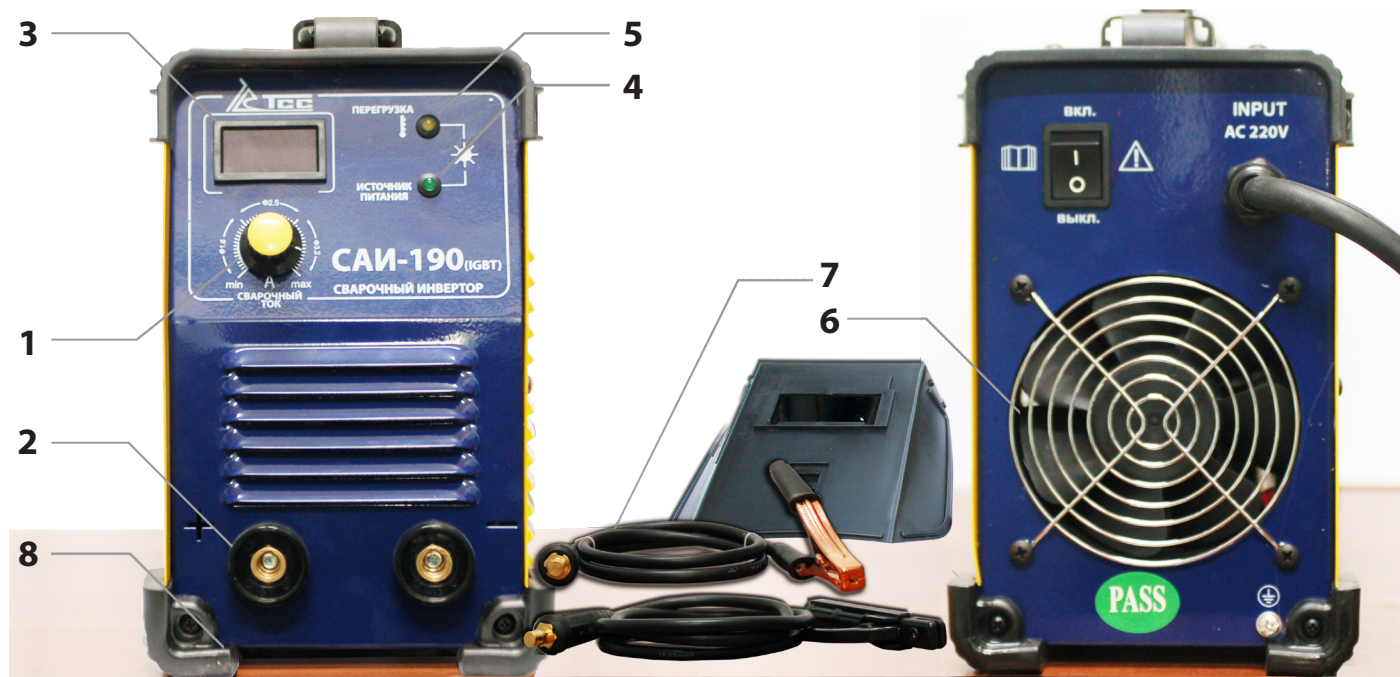
1 - регулировка сварочного тока; 2 - выходы для подключения кабеля; 3 - цифровой дисплей; 4 - индикатор сети; 5 - индикатор перегрузки; 6 - вентилятор; 7 - кабель; 8 - прорезиненные углы.